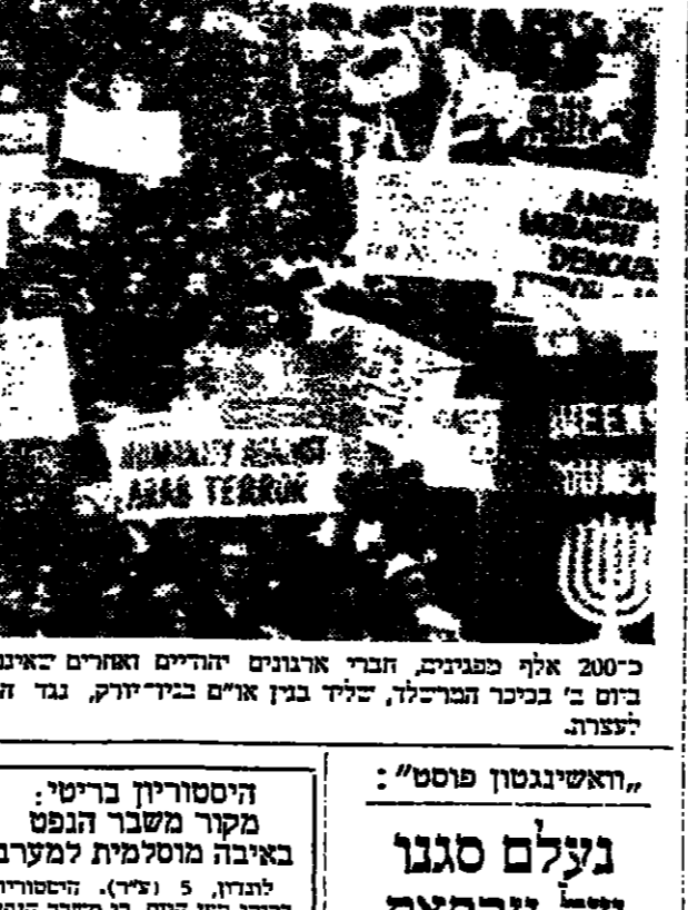
200-אלף פגזות, חבר ארגונים יהודיים ואחרים יתחייבו בהפגנת התוכנית...